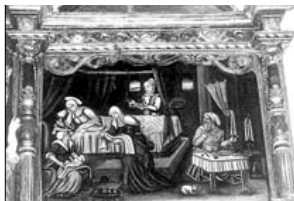
RETABLO MAYOR Natividad de la Virgen en el tercer cuerpo del retablo.

Texto y fotos F.J. Ignacio López de Silanes Valgañón