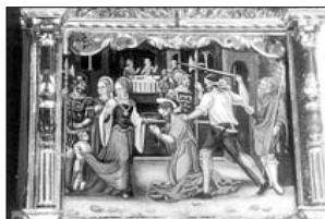
RETABLO MAYOR Degollación del Bautista en el segundo cuerpo del retablo.