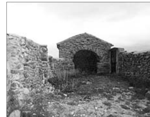
Interior de la Magdalena, visto hacia el presbiterio