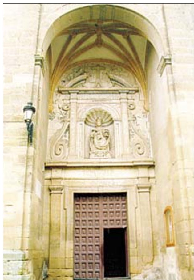
F.J.I. LÓPEZ DE SILANES

La Virgen de Castañares, nuestra señora de la Silla, abandona su trono en el retablo mayor durante la época estival, para presidir desde el presbiterio los trabajos de la recolección de los campos.