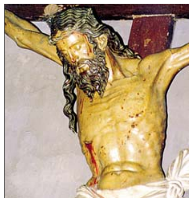
F.J.I. LÓPEZ DE SILANES Cristo, siglo XVI. Capilla de San Sebastián

La obra se continuó a partir del año 1578 con una nave en tres tramos, presentado capillas entre los contrafuertes en los dos primeros, lo cual también era usual en las plantas tipo Reyes Católicos; con la particularidad de que en Castañares las capillas se desarrollan con la misma altura que la nave central, realizando así la grandiosidad de los espacios interiores. Parece que existió un cambio de proyecto en la