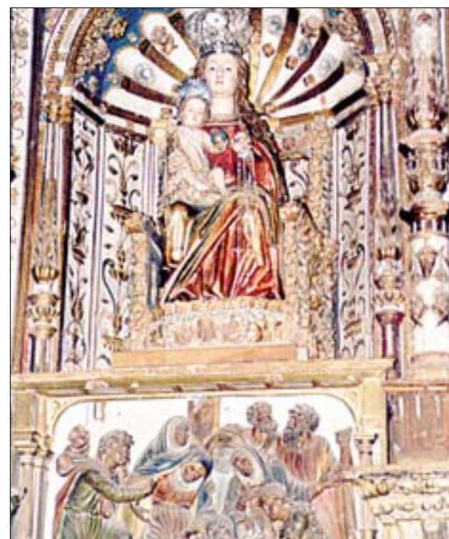
Virgen de la Silla e imagen de San Miguel