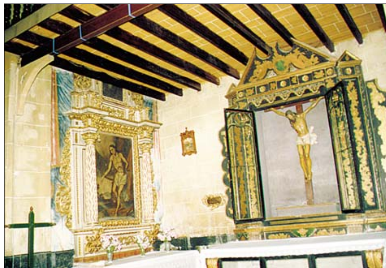
Capilla de San Sebastián, cortada por la expansión del coro alto

Del resto de los retablos de la iglesia, hacemos especial mención al retablo del Cristo que se encuentra situado en la Capilla de San Sebastián, que contiene un bello Crucifijo manierista de mediados del siglo XVI, y al retablo de la capilla de la Virgen de Guadalupe, rococó de mediados del XVIII, que consta de banco, dos cuerpos y tres calles, donde en torno al lienzo de la Virgen de Guadalupe realizado en México en el año 1754, se distribuyen las imágenes de San José, y las de San Joaquín y Santa Ana cuya fiesta conmemoramos en el día de hoy.