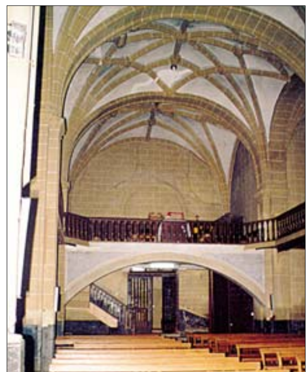
Izquierda, vista de la nave hacia el coro alto. Derecha, vista de la nave hacia el presbiterio