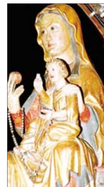
F.J.I. LÓPEZ DE SILANES

Cúpula de la basílica, con las pinturas de la Glorificación de la Virgen (s. XVIII). Talla de la Virgen de la Vega del siglo XIV