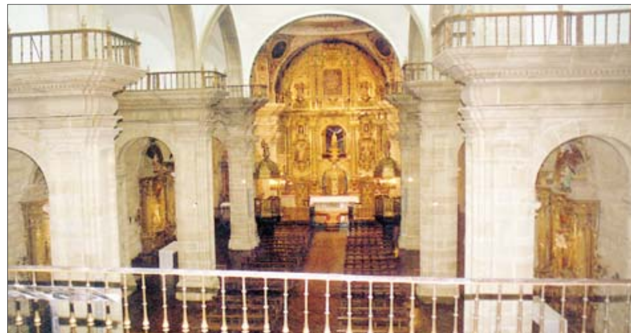
F.J.I. LÓPEZ DE SILANES

Perspectiva desde el coro de las tres naves de la basílica