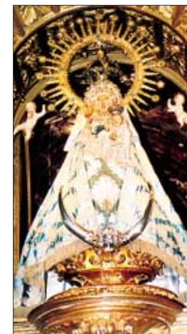
F.J.I. LÓPEZ DE SILANES

Cúpula de la sacristía (s. XVIII) donde se observan los estragos causados por el agua en la escena del fondo. En la imagen de la derecha, Virgen de la Vega, con sus símbolos en la mano derecha: la granada y las espigas de trigo, que representan sus tradicionales leyendas