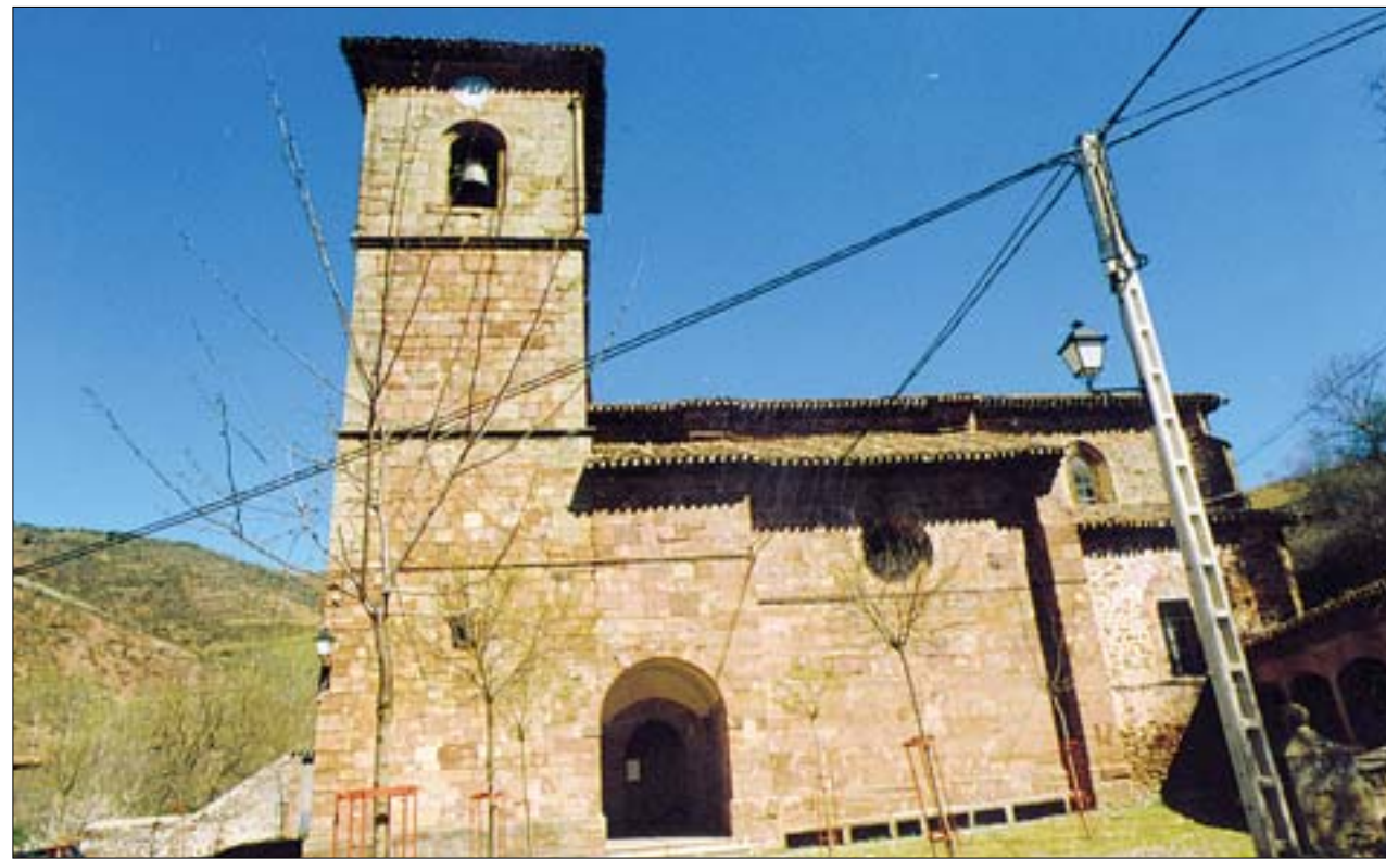
Fachada sur de la iglesia. Destaca la esbeltez de la torre del siglo XVI