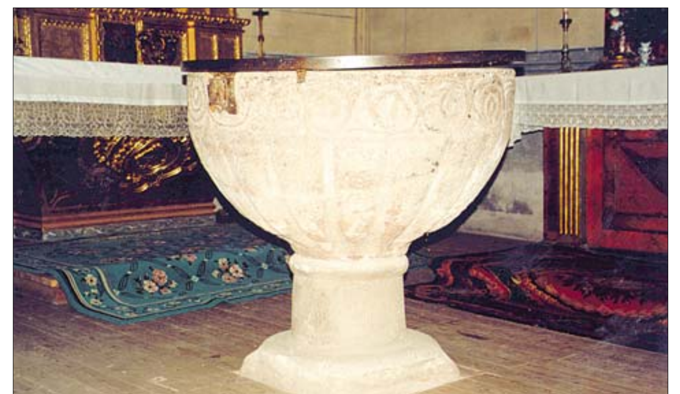
En la imagen superior izquierda, vista del puente medieval. De arriba a abajo, vista del espacio interior que se ve realizado por la falsa nave del evangelio, y pila bautismal