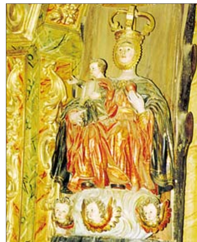
De arriba a abajo, retablo mayor y Virgen de Valvanera, en la iconografía del siglo XVIII