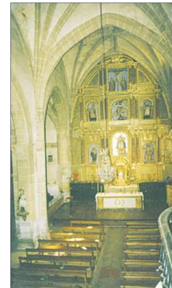
Nave, presbiterio, coro alto y las bóvedas de tracería